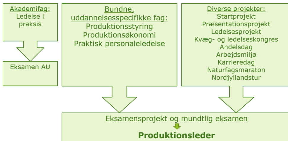
Figur 2 Oversigt over fag og læringselementer i Landbrugsuddannelsens hovedforløb, speciale Produktionsleder.

Forløbets fag og læringselementer fremgår af figuren herunder.